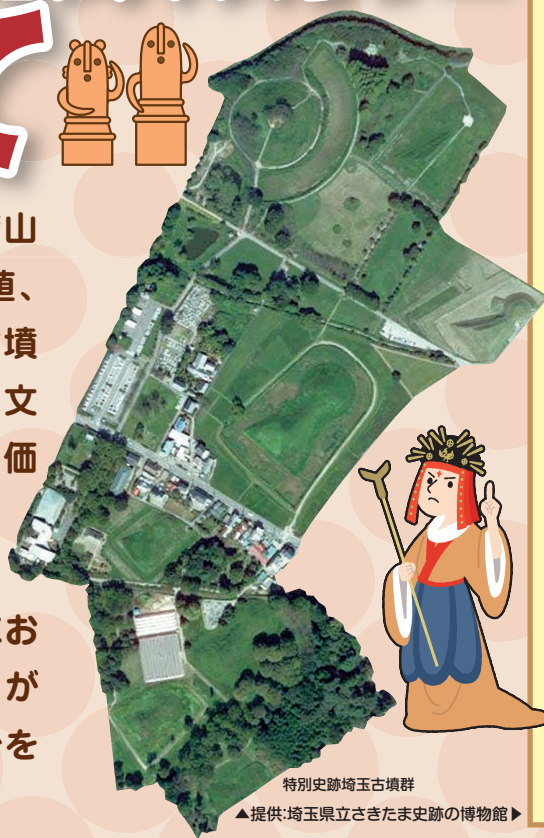
特別史跡埼玉古墳群